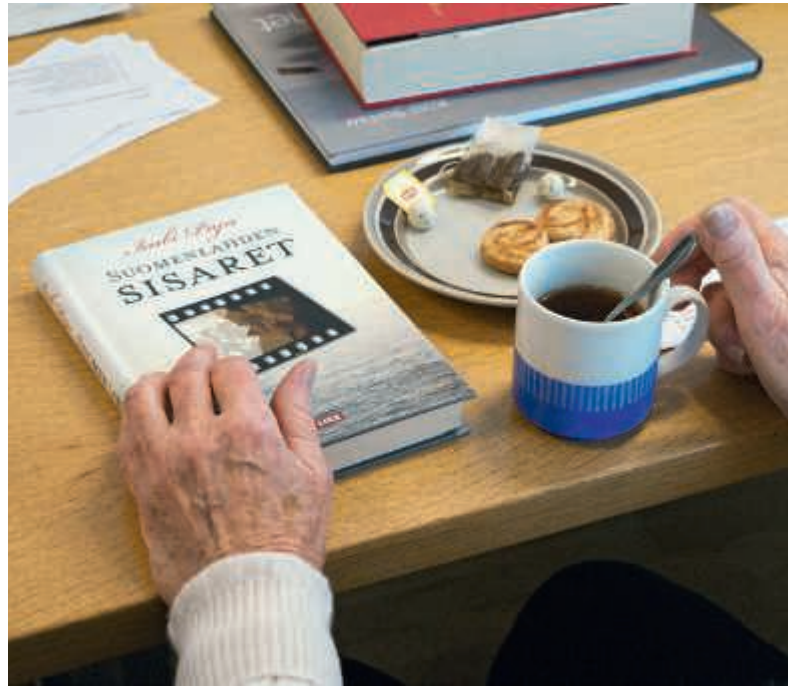
Kirjallisuuspiiriin kirjat valitaan piiriläisten omien ehdotusten pohjalta.