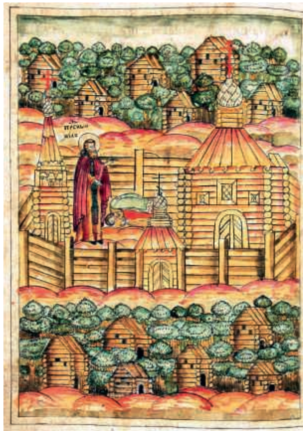
Nil Sorski seisoo Herran temppeleintuomisen kirkon pihalla. Hänen rakkain oppilaansa Innokenti on polvistunut. Skiitan keljat sijaitsevat metsässä toisistaan erillään. Puupiiirros 1600-luvulta.

Suuri hesykasti ei langennut omahyväisyyden ja ylpeyden harhaan. Hänen esimerkkinsä haastaa jokaisen kristityn, joka tuntee suurempaa vetoa oppiriitihin kuin rauhaan ja hiljaisuuteen. Kun Nil kuoli vuonna 1508, hänet haudattiin hänen toiveidensa mukaan äärimmäisen vaatimattomasti. ●