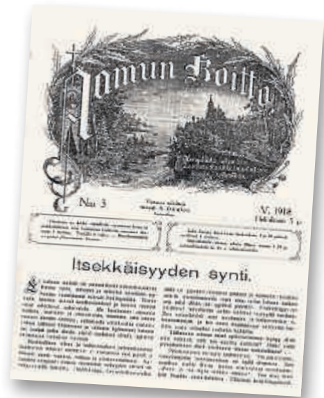
Aamun Koitto ilmestyi koko kevään 1918 ajan.