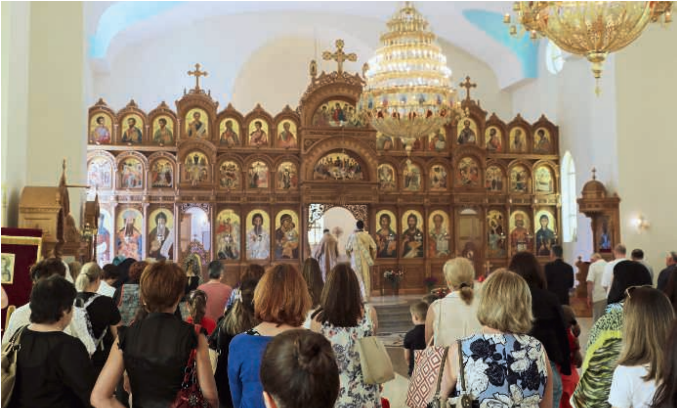
Jumalanpalvelukset ovat Australiassa asuville serbialaistauksille yhdysside omaan kieleen ja kulttuuriin.