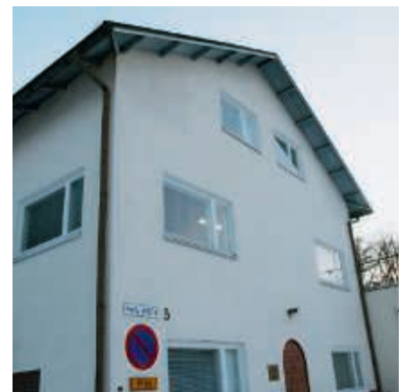
Ilta saapuu, mutta keskustelu jatkuu vilkkaana seurakunnan kerhohuoneella Harjukatu viidessä.

Ilta laskeutuu hiljalleen Lahteen, mutta vilkas keskustelu kerhohuoneel-