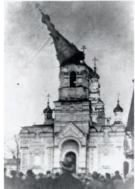
Hämeenlinnan ortodoksinen kirkon tornia puretaan 1923.

Varsinaisissa taisteluuissa ortodoksiset kirkot kärsivät varsin vähän vaurioita, mutta kirkkoja saatettiin tarvella kylläkin tarkoituksellisesti. Pahin esimerkki on tietävästi Tampereen kirkon kokema tuho kaupungin valtauksen jälkeen huhtikuussa 1918. Valkoiset valloittajat hajottivat kirkon sisustusta ja samassa yh-