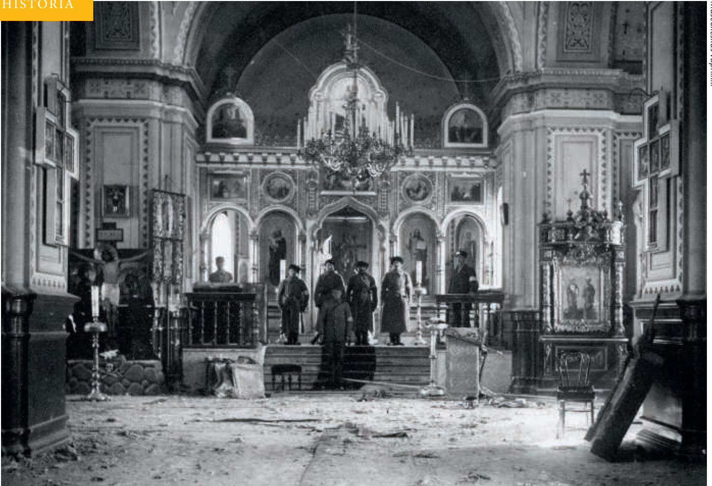
Valkoisia sotilaita Tampereen ortodoksisen kirkon alttarilla 1918. Valloittajat hajottivat kirkon sisustusta.