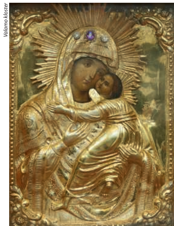
Gudsmoderns ikon 'den Sött Kyssande' stammar från Athosberget.

Det finns uppförbackar och nedförbackar och det kan man ingenting åt men det gäller att inte glömma vart man är på väg och att hålla kursen mot Gud. ●