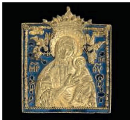
Metalli-ikoneja on valmistettu kirkon alkuaajoista saakka.

Eryyisesti ukrainalaisten käspaikkojen värien, kuvien ja symbolien rikkaus kiehtoo.