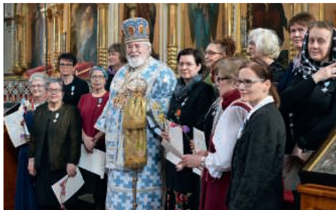
Arkkipiispa Leo palkitsi ansioituneita äitejä Uspenskin katedraalissa.