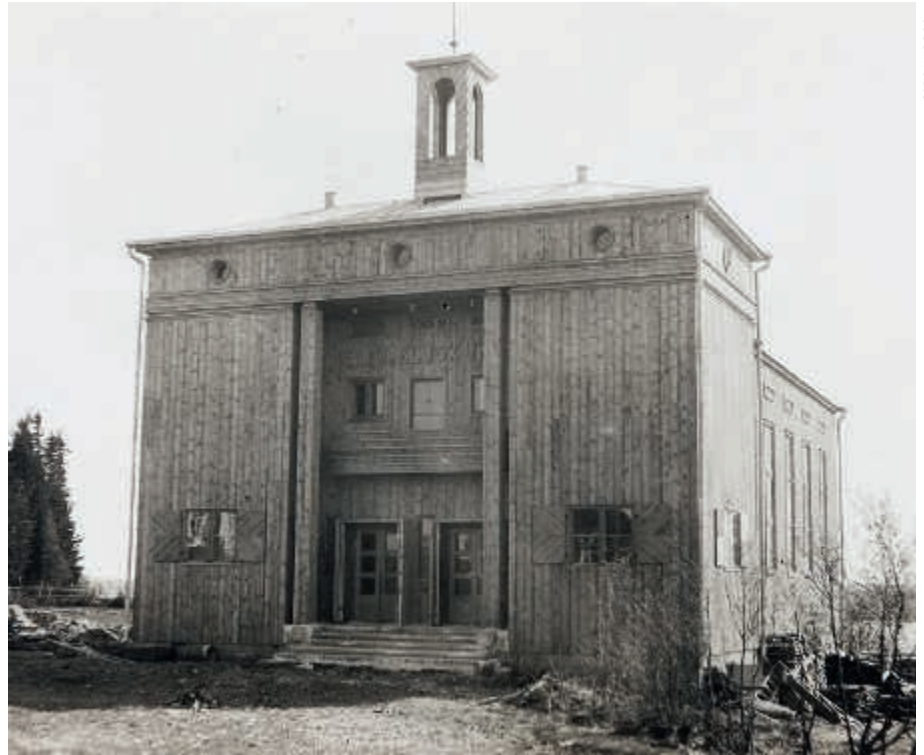
Suistamon suoje-luskuntatalo. Kuva 1920-luvulta.

Etelällä mainittujen toimenpiteiden kautta punainen hallinto halusi suistaa porvarillisen yhteiskunnan vanhoilliseksi tukipylyväksi koetun luterilaisen kirkon asemastaan. Siinä sivussa olisi mennyt myös ortodoksinen kirkko.