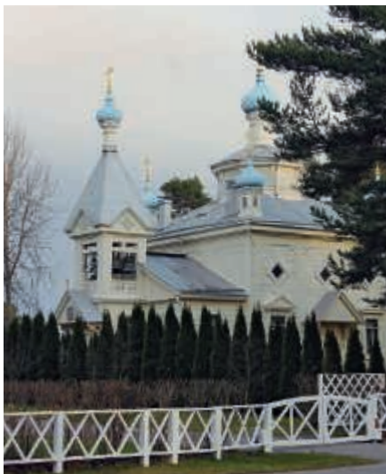
Hangon kirkko kokoa pyhiinvaeltajia yhteen kauempaakin.

Jumalanpalvelusten lisäksi kirkossa kokoontuu kerran kuukaudessa kerho,