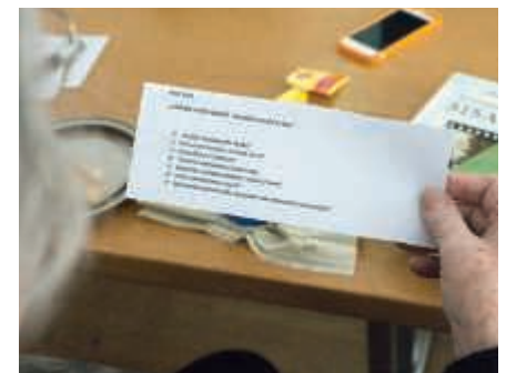
Toisinaan piirissä käytetään kysymyslappusia keskustelun pohjana.

Varsin nopeasti käy selväksi, että tässä piirissä keskustellaan vilkkaasti eikä eriäviä mielipiteitä hätkähdetä.