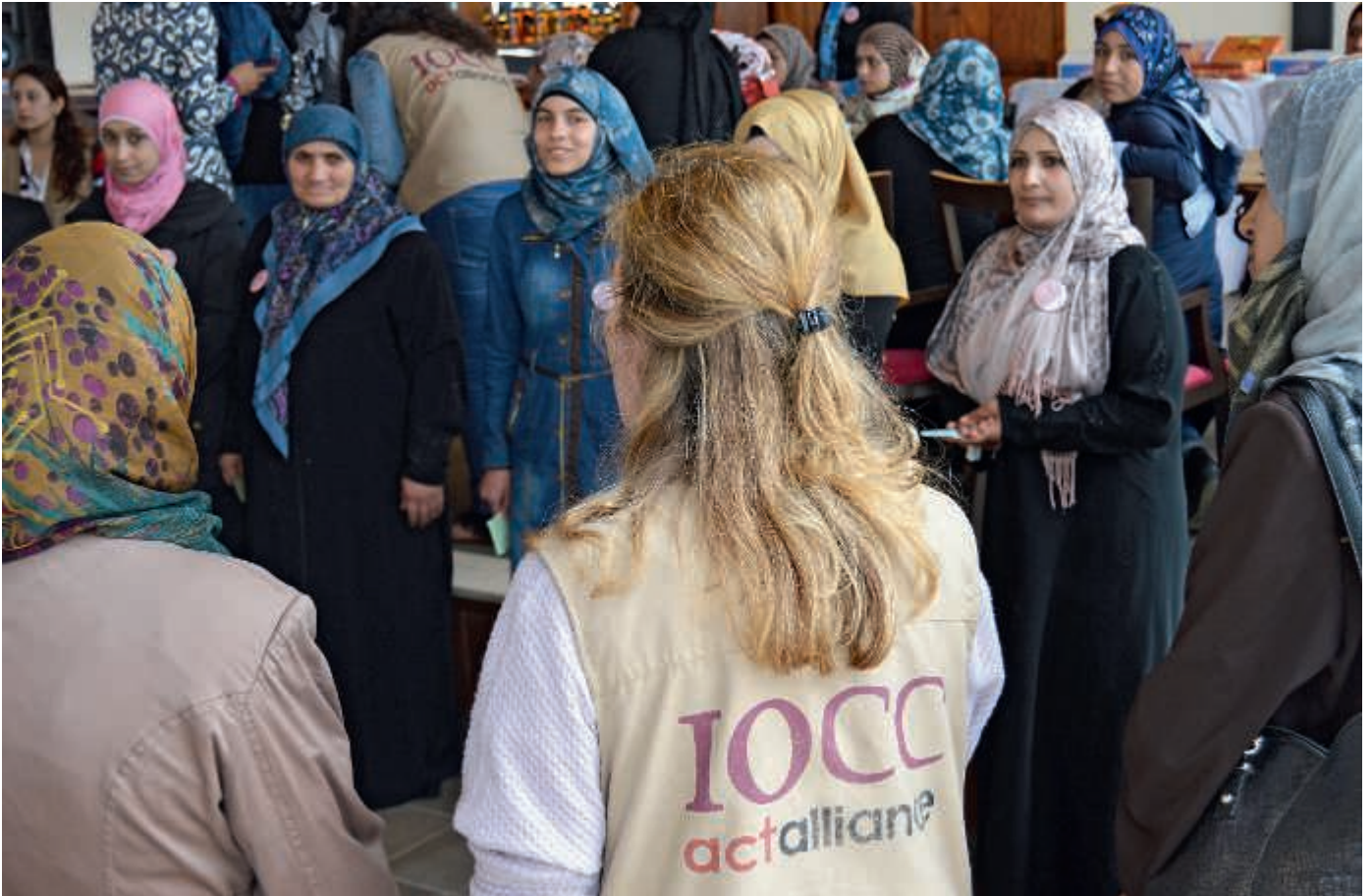
IOCC on Filantropian pitkäaikainen kumppani. Pakolaisperheitä tuetaan esimerkiksi kouluttamalla äitejä lasten terveyteen ja ravitsemukseen liittyvissä kysymyksissä.