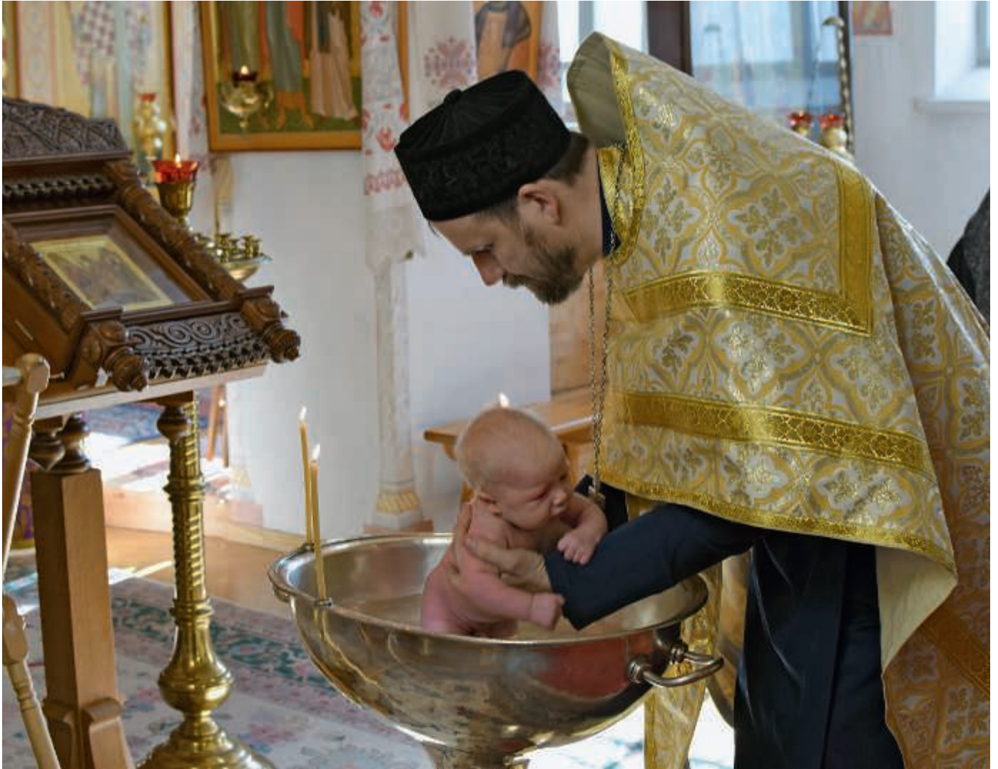
Uskontunnustus lausutaan ensi kerran kasteen sakramentin yhteydessä, jossa kummi lukee tunnustuksen kastettavan puolesta.