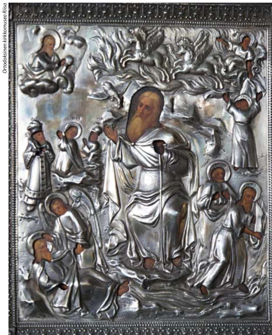
Ortodoksinen kirkkomuseo Riisa

Myöhemmin Samuel saa tuntea esirukouksen arvon ja taakan: ”Enkä minäkään voi tehdä sellaista syntiä Herraa vastaan, että lakkaisin rukoilemasta puolestanne. Minä opetan teille sen, mikä on hyvää ja oikein” (1.Sam. 12:23).