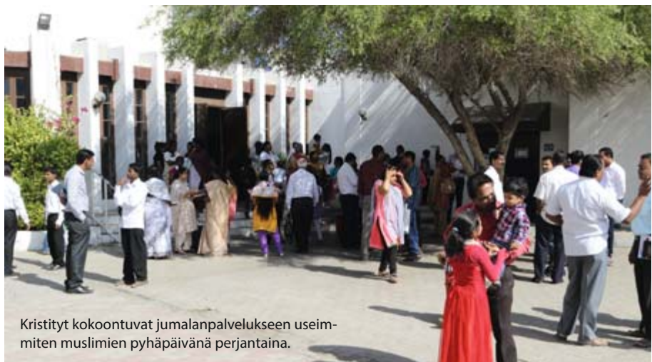
Kristityt kokoontuvat jumalanpalvelukseen useimmiten muslimien pyhäpäivänä perjantaina.