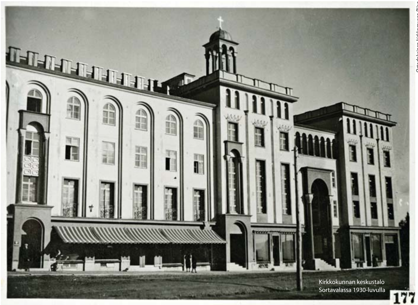
Kirkkokunnan keskustalo Sortavalassa 1930-luvulla