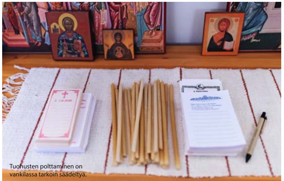
Tuohusten polttaminen on vankilassa tarkoin säädeltyä.

etenkin lähimmäisenrakkaus ja yhteisöllisyys.