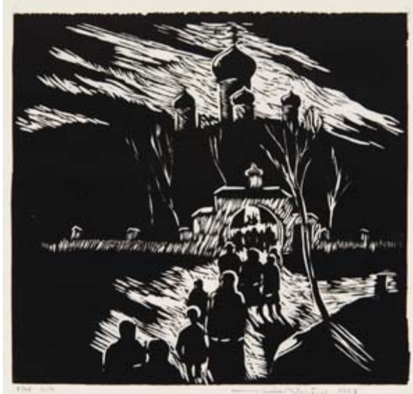
Pääsiäisyö, linoleikkaus, 1943. Tampereen taidemuseo