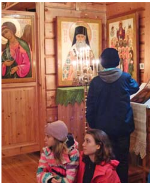
Det är viktigt att se att det finns jämnåriga ortodoxa unga.

I en tid av sparåtgärder gäller det därför också för församlingen att vara lyhörd inför dessa utmaningar, och göra det man kan för att trygga alla elevers lika rätt till undervisning i egen religion.