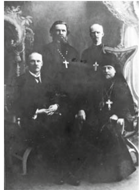
Konstantinopolin delegaatio vuonna 1923.

Vuonna 1885 perustettu ja autonomian ajan lopun venäläistämiskaudella hiipunut Pyhien Sergein ja Hermanin Veljeskunta (PSHV) virkistyi, ja siitä tuli tärkeä valistus- ja sisälähetysjärjestö. Se järjesti kursseja pyhäkoulunopettajille sekä