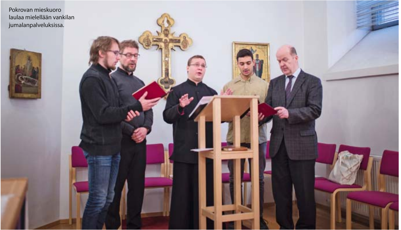
Pokrovan mieskuoro laulaa mielellään vankilan jumalanpalveluksissa.

kien matkojen päässä. Sitä saa itse olla vä- lillä ikään kuin äitinä ja isänä tässä työssä.