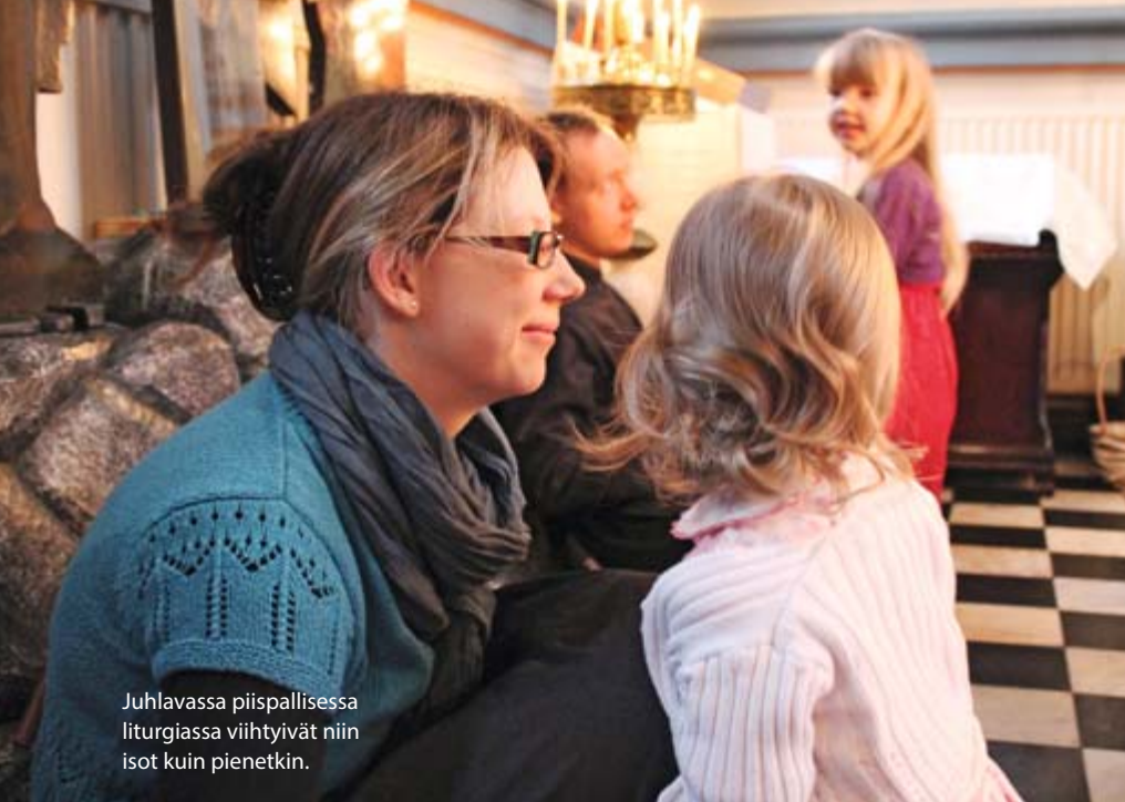
Juhlavassa piispallisessa liturgiassa viihtyivät niin isot kuin pienetkin.

Kirkkoherra kertoo, että ristiriidoitta monikielistä käytäntöä ei ole otettu vastaan, mutta hän antaa seurakuntalaisilleen tunnustusta.