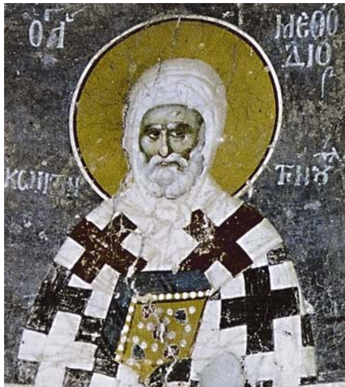
Kuvainraastajat murskasivat Methodioksen leuan ja hänet kuvataan usein pää siteissä. Kreikkalainen fresko.

kuolonuneeen 14.6.847. Suuren kilvoittelijan nöyrytyminen ja tarpeettoman kiivailun katuminen ovat esimerkki meidänkin aikamme kristityille. Niin paljon kuin totuutta rakastammekin, emme saa koskaan vastata virheisiin virheillä.