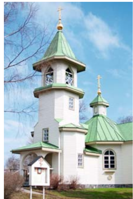
Imatran kirkko ja sen pihapiiri on saatava syksyksi juhlahakuntoon, sillä kirkko täyttää 60 vuotta.