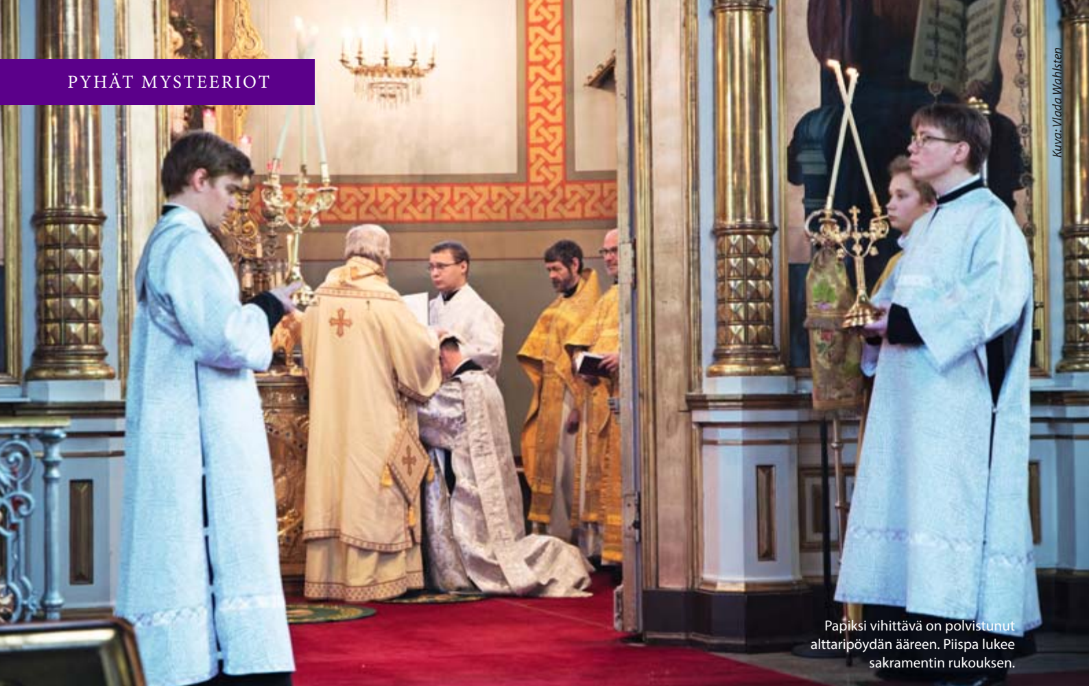
Papiksi vihittävä on polvistunut alttaripöydän ääreen. Piispa lukee sakramentin rukouksen.