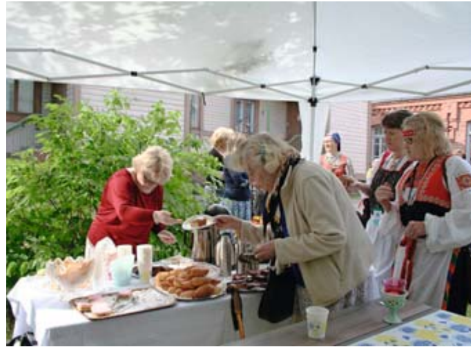
Kirkkokahvitusten ja myyjäisten ohella Pappilan pihakahvila on saanut suosiota lappeenrantalaisena kesätapahtumana.