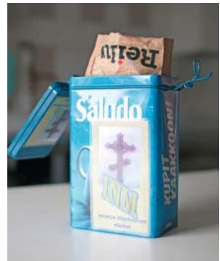
Imatran Nikolaoksen miehet eivät tarvitse naisten apua kahvinkeitossa.