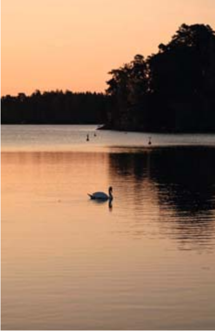
Luonto tukee luonnollisen rytmin löytymistä.

jentää arjen rutiinit, tuo iankaikkisuuden läsnäolon kuluvaan aikaan.