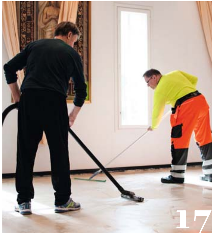
Nikolaoksen miehet ahkeroivat Imatralla hengellisyyttä unohtamatta.