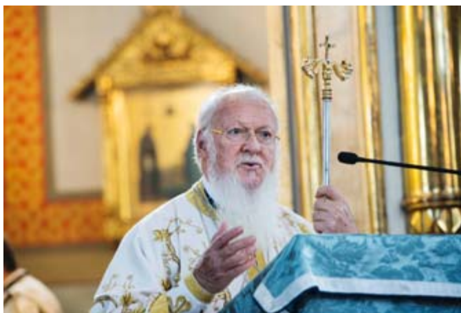
Patriarken Bartolomeos ansvarar för arrangemangen av den heliga synoden.

(1) Den ortodoxa kyrkans uppdrag i dagens värld; (2) Den ortodoxa diasporan; (3) Kyrkligt självstyre (autonomi) och hur det fastställs; (4) Äktenskapets sakrament och äktenskapshinder; (5) Fastans betydelse och fastande i nutiden; (6) Ortodoxa kyrkans förhållande till den övriga kristenheten.