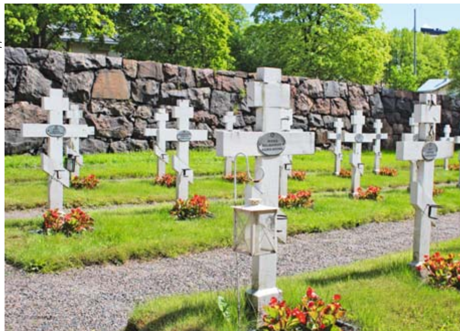
Helsingin Hietalahdessa on kauniisti hoidettu ortodoksinen sotilashautausmaa, jossa lepää noin 60 sotien 1939–1944 sankarivainajaa.

Mannerheim kielsi Helsinkiin tammi-kuuksi 1944 suunnitellun ikoninäytelyn sillä perusteella, että ikonit eivät ole Suomen omaisuutta. Myös yksi tsasouna oli suunniteltu siirrettäväksi Helsingin Seurasaareen, mutta marsalkan kanta esti tämänkin. Hänen mielestään Itä-Karjalan väestö tarvitsi rukoushuoneensa itse.