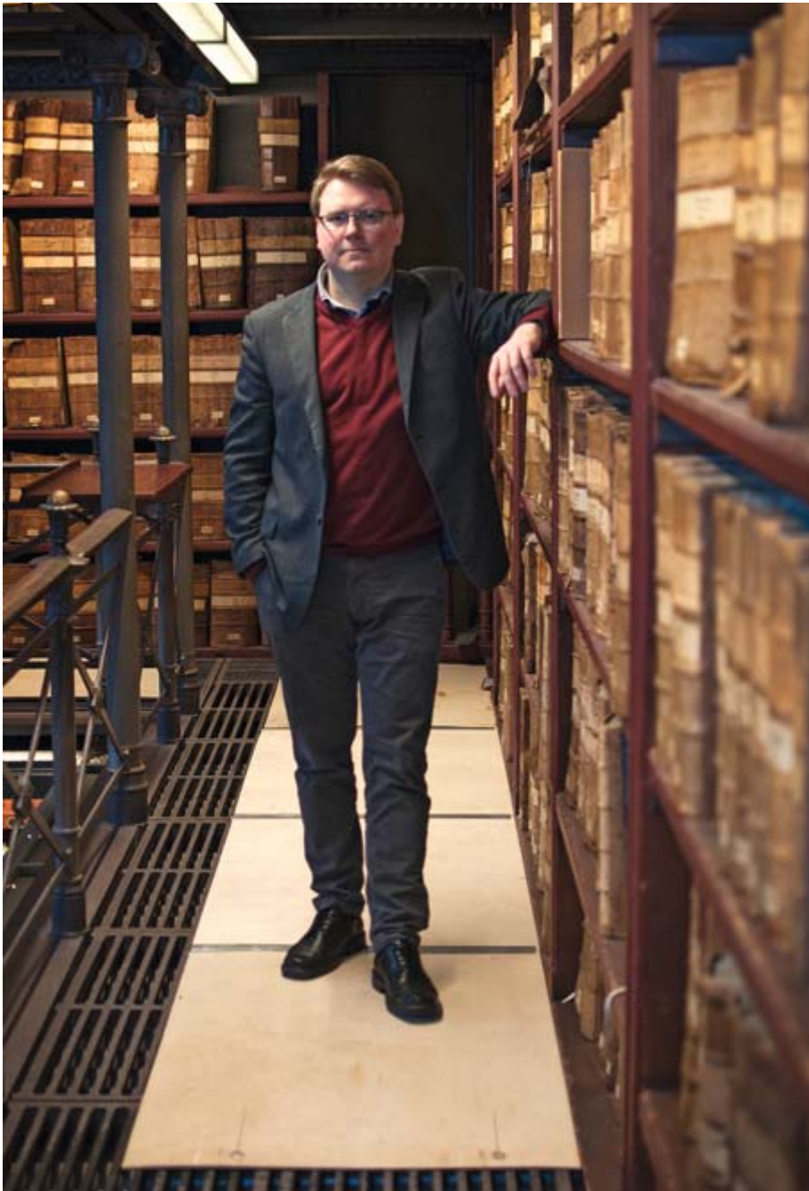
Porvalin ensimmäinen dekkari sai hyvät arviot. Se aiheuttaa kirjailijalle paineita sarjan jatkamiseen.

hemminkin hän on halunnut säilyttää kosketuksen ortodoksiseen kulttuuriin.