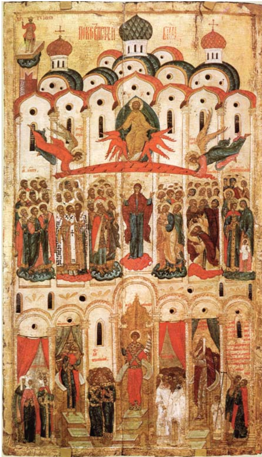
Pokrovan eli Jumalanäidin suojeluksen ikoni. Novgorodilainen ikoni 1401–1425. Tretjakovin galleria, Moskova.

sa valistuksen ja puhdistumisen vaiheiden kautta, joiden tuloksena saavutetaan jumalallisuus.