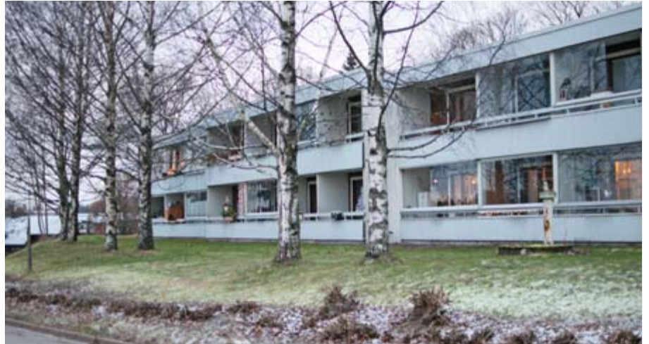
Stefanoskodissa asuu reilut 70 henkilöä. Asuntolan rivitalot on rakennettu 1970-luvulla.