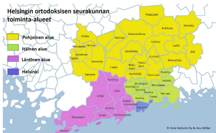
Kuva 2. Toiminta-alueiden jäsenmäärät 31.12.2022